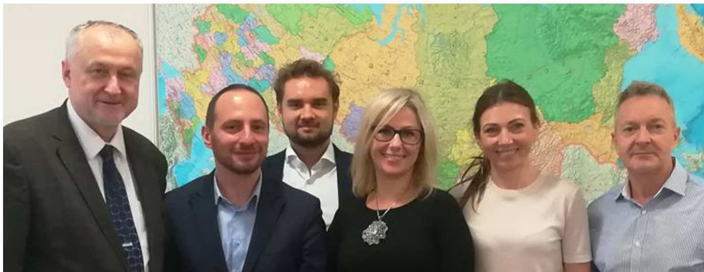
SZKOLENIE Z ZARZĄDZANIA WYNIKAMI BADAŃ DLA RUSADA