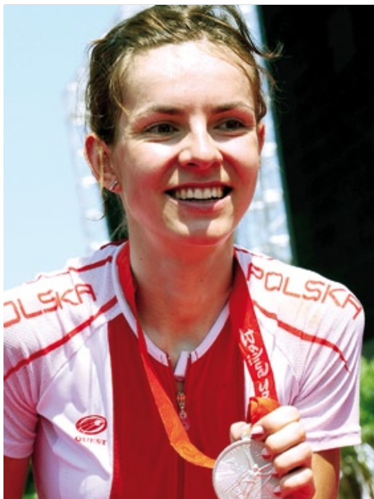
Maja Włoszczowska – dwukrotna srebrna medalistka Igrzysk z Pekinu 2008 i Rio (2016)