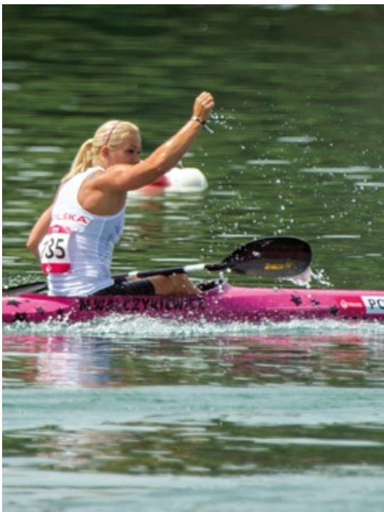
Marta Walczykiewicz srebrna medalistka olimpijska z Rio (2016). Polacy zdobyli łącznie 20 medali olimpijskich.