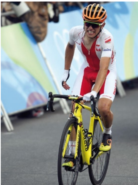
Rafał Majka zdobył brązowy medal olimpijski w Rio (2016) w wyścigu ze startu wspólnego