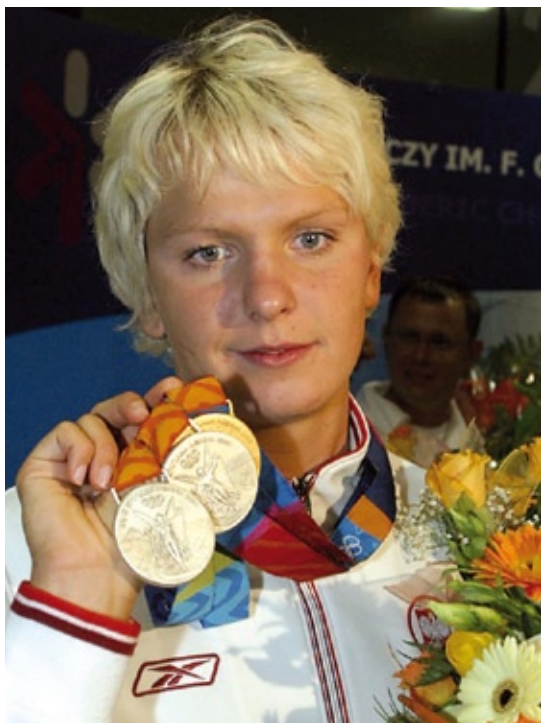
Otylia Jędrzejczak – najlepsza polska pływaczka, złota i dwukrotnie srebrna medalistka z Aten (2004)