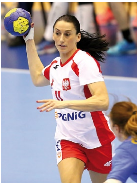
Kobiety rywalizują w tej dyscyplinie od Igrzysk Olimpijskich w Montrealu (1976)